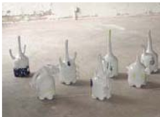
Détail de Famille marine 7

Le concept de « Terra Incognita » : partir à la reconquête de ses origines. L'espace-temps par la mise en scène de créatures métaphoriques sillonnant le monde.